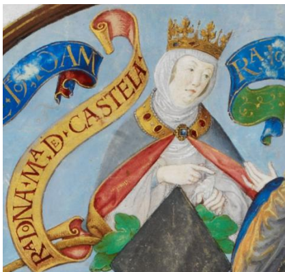
María de Portugal, miniatura de Genealogia dos Reis de Portugal (s. XVI)

El 24 de junio de 1328, Alfonso XI se casa con su prima hermana María de Portugal. Entre los regalos que le hace a la reina se encuentra la ciudad de Talavera, a partir de esa fecha nuestra ciudad toma el nombre de Talavera de la Reina. (La Reina María ordenó encarcelar a la amante del rey Leonor de Guzmán en el alcázar de Talavera, donde murió ejecutada en 1351). Leonor de Guzmán fue la madre del primer monarca de la Casa de Trastámara, Enrique II de Castilla; éste cedió nuestra ciudad al arzobispo de Toledo, Gómez Manrique, el 25 de junio de 1369.